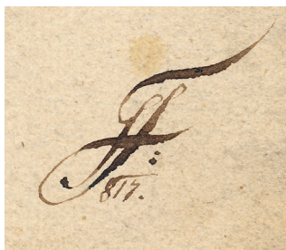
Obr. 2 Ukázka monogramu „JF“ na titulní straně hudebniny pořízené v roce 1817 Josephem Andreasem Fiedlerem (P. Cajetan Vogl: Missa Solennis in G. CZ-TEK , bez signatury)