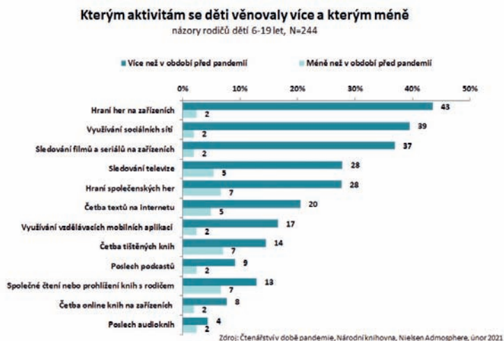
Graf 2 Kterým aktivitám se děti v období pandemie věnovaly více a kterým méně než v běžném období