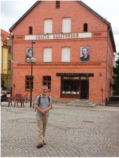
Polsko, Olsztyn 2017

proměňují. Je samozřejmé, že se tyto aspekty nedají od sebe zcela oddělit, je rovněž těžké vyhnout se zohledňování historických otázek, i kdybychom se chtěli zaměřit výlučně na současnost, která se nám před očima mění v minulost. Čtenářství je utvářeno generacemi a na žádném jiném příkladu to není vidět tak dobře, jako na tom českém. Trávničkův přínos v této oblasti je právě tak rozvětvený a komplexní. Lze jej rozdělit do čtyř skupin. Ze zřejmých důvodů se zde zaměřím na knihy a vynechám jiné jeho četné a stejně důležité práce.