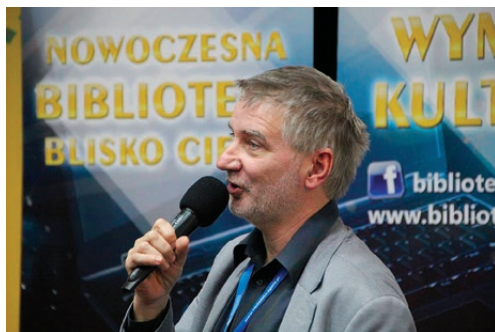
Polsko, Zielona Góra 2018 - knihovnická konference